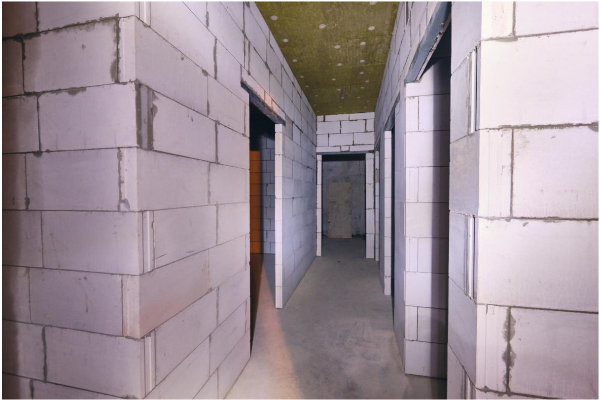
Корпуса 2.2 и 2.3.